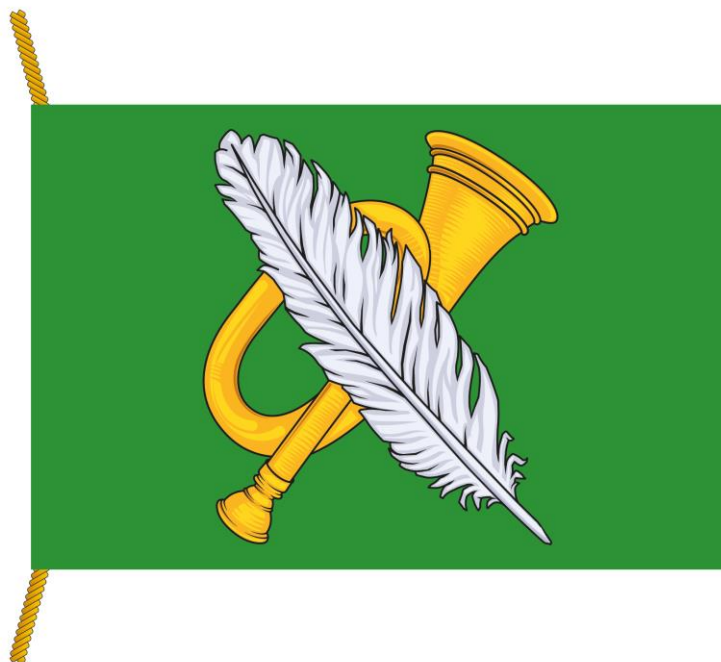
РИСУНОК ФЛАГА МУНИЦИПАЛЬНОГО ОКРУГА ПЕРОВО В ГОРОДЕ МОСКВЕ (лицевая сторона)